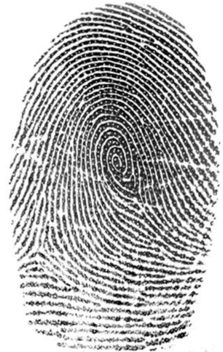
La impresión dactilar obtenida con el FS88 es de tan alta calidad, que inclusive pueden apreciarse los poros ubicados en las crestas dactilares.

Bioidentidad brinda asistencia técnica especializada, acompañada de garantía y asesoría experimentada en biometría.